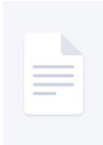
График оценочных процедур на 2023/24 учебный год

Положение о системе оценивания по ФГОС и ФОП