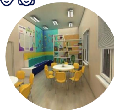
ЦЕНТРЫ ДЕТСКИХ ИНИЦИАТИВ