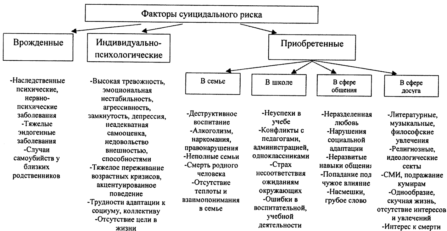
Рис.1. Факторы суицидального риска