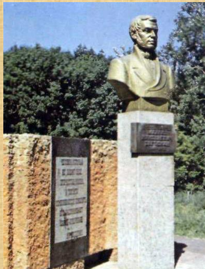
Памятник М.Н. Загоскину в Рамзае