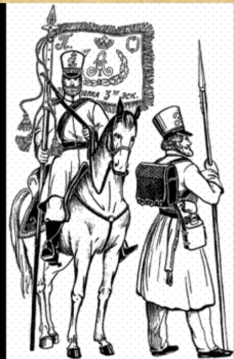
Пензенские ополченцы (конный и пеший) в Отечественную войну 1812 г.

Нашествие франц. армии на Россию вызвало подъем патриотизма во всех слоях рус. общества. Неизвестный автор «Рассуждения о покушении французов на Россию», хранящегося в Гос. архиве Пенз. обл., писал: «Старый и малый – все вооружились за славу и честь имени русского. Тут только началась война и война страшная, ибо сделалась войной народа, которая не может иначе кончиться, как истреблением врага». Спустя месяц после вторжения франц. армии был издан манифест имп. Александра I «О составлении временного внутреннего ополчения». Пенз. губ. входила в третий округ формирования ополчения вместе с губерниями – Казанской, Нижегородской, Костромской, Симбирской и Вятской. Особый подъем наблюдался среди крепостных крестьян, к-рые, вступая в ополчение, надеялись на освобождение от крепостной зависимости. Формированием ополчений и сбором пожертвований ведали специально учрежденные ком-ты. Ополчение комплектовалось в осн. из крепостных крестьян; командные должности занимали в ополчении дворяне. Возраст ратников от 17 до 50 лет. В течение сент. были сформированы: в Саранске 1-й пех. полк, в Мокшане 2-й пех. полк, в Инсаре 3-й пех. полк, в Краснослободске 4-й пех. полк, в Пензе конный полк. К ноябрю 1812 Пенз. ополчение было сведено в дивизию из 3 пех., 1 конного полков и арт. команды из 68 чел. при 4 орудиях. Всего в ополчении было 9847 чел.