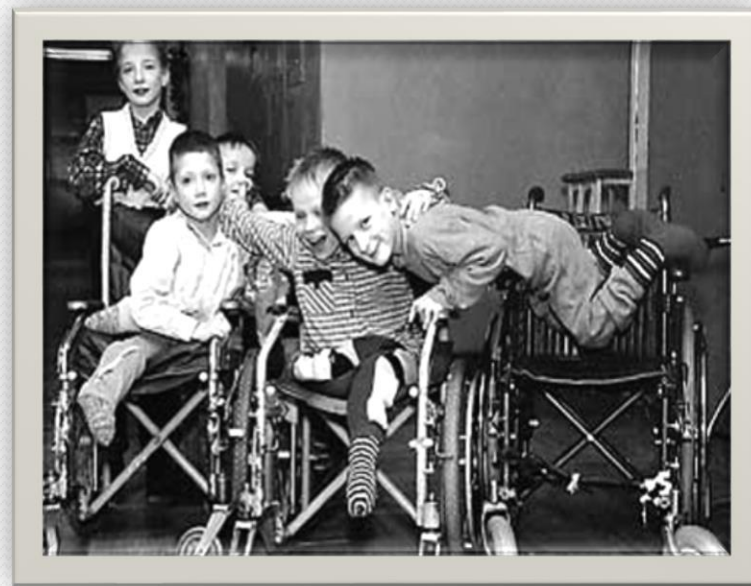
Школа для детей с ДЦП.