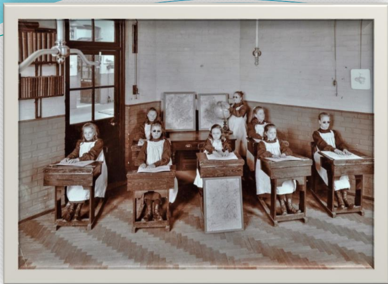
Учебное заведение для слепых.