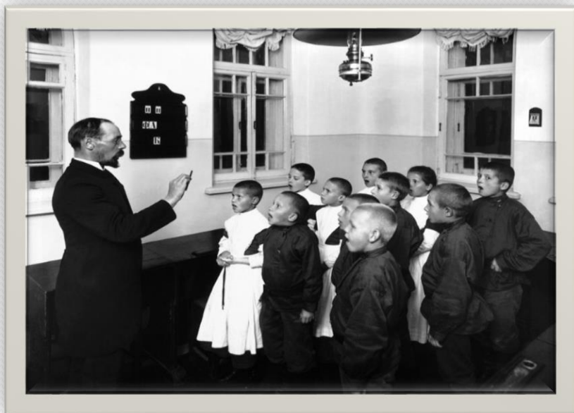
Школа для глухих детей.