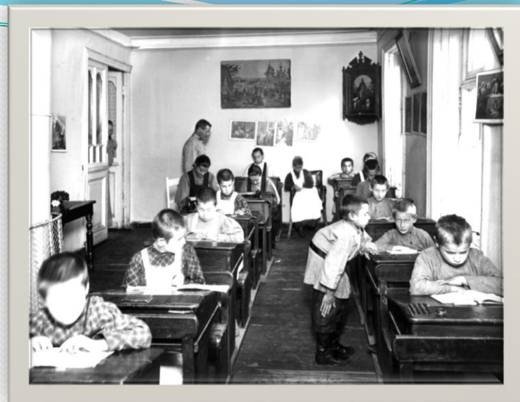
Школа для детей, перенесших полиомиелит.